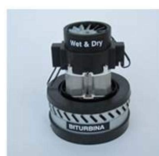
motore bistadio by-pass 1300w max