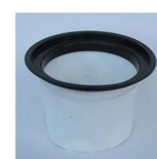
filtro poliestere lavabile cm 2 6900