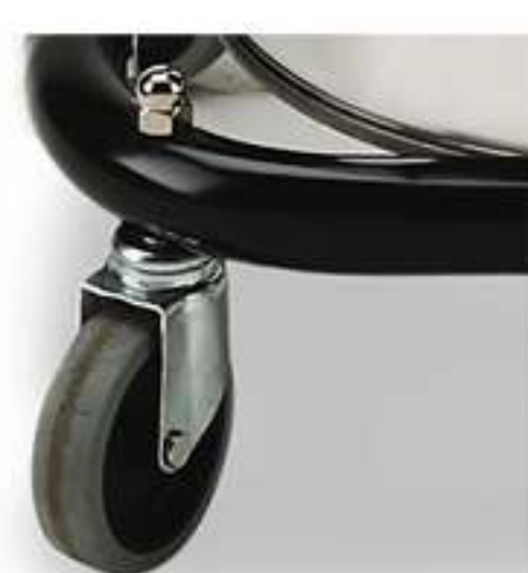
carrello metallo Ø 40 molto robusto